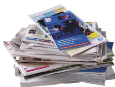
Journaux, revues, magazines